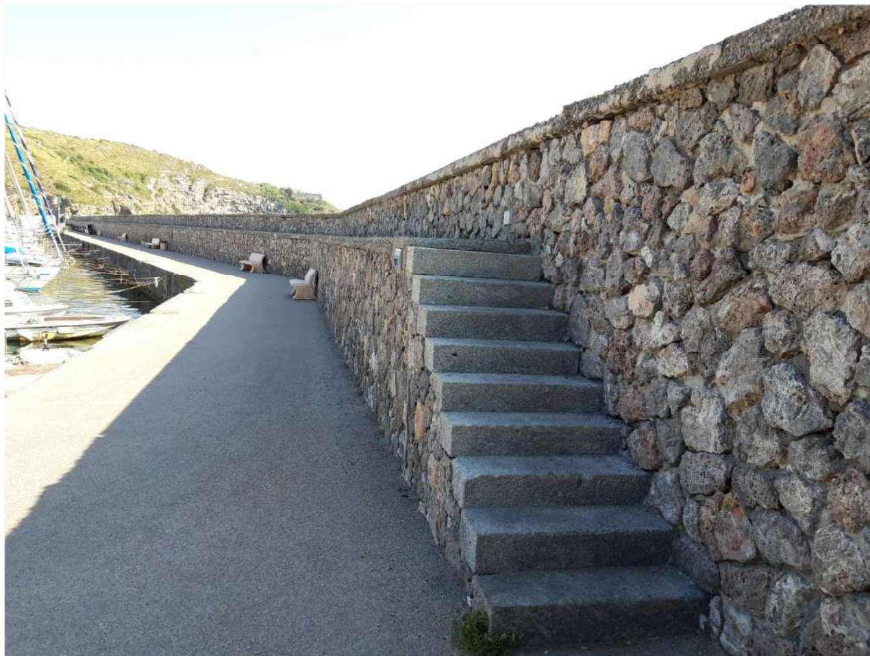
Camminamento oggetto d'installazione del parapetto e del trattamento di ripristino